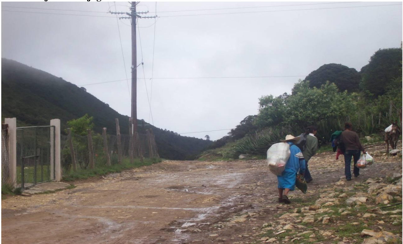
Imagen 11- Señoras de El Muerto, cargando sus víveres en costales o bolsas, y emprendiendo el camino por veredas, donde van a pie al menos por dos horas y media