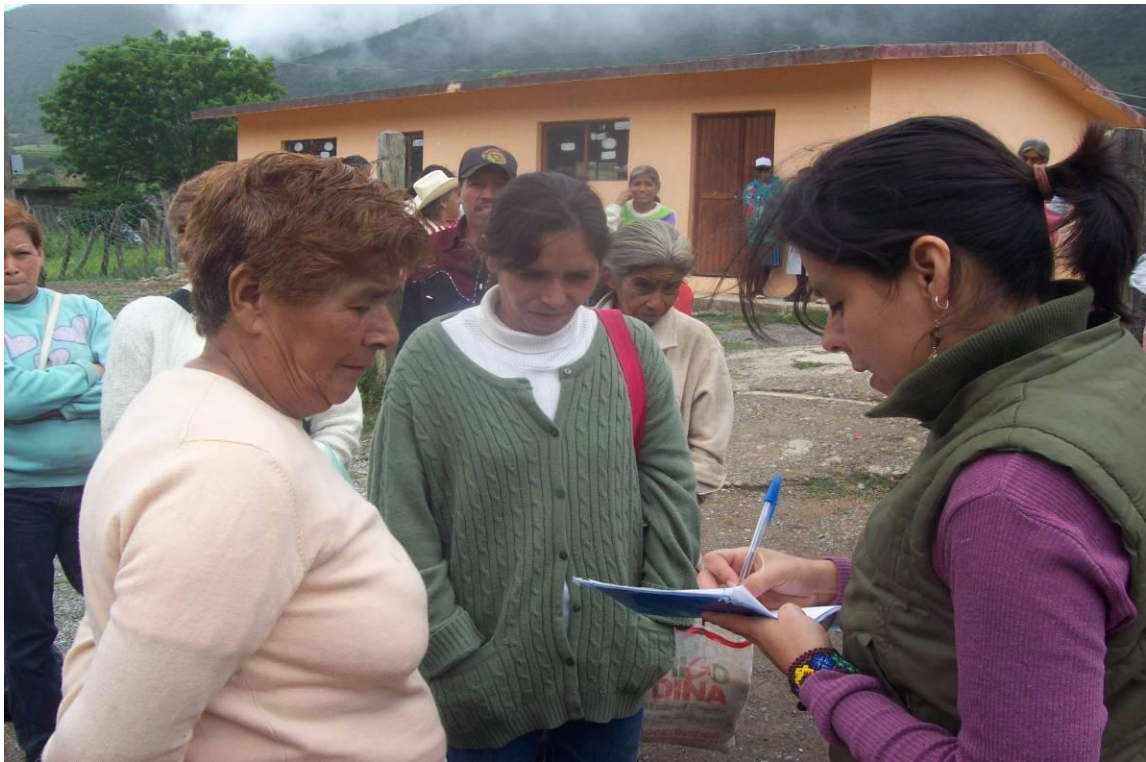
Imagen 4. Registro de las personas de la comunidad de El Muerto a la entrega de víveres