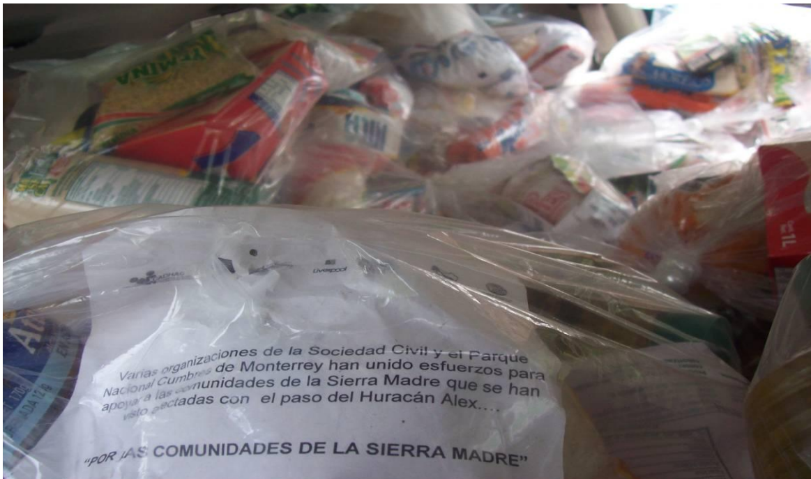
Imagen 1. Detalle de las despensas entregadas a las personas en las comunidades.