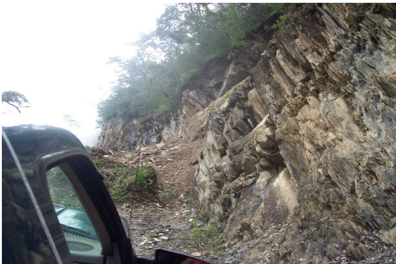
Imagen 2- Derrumbes presentes en el camino