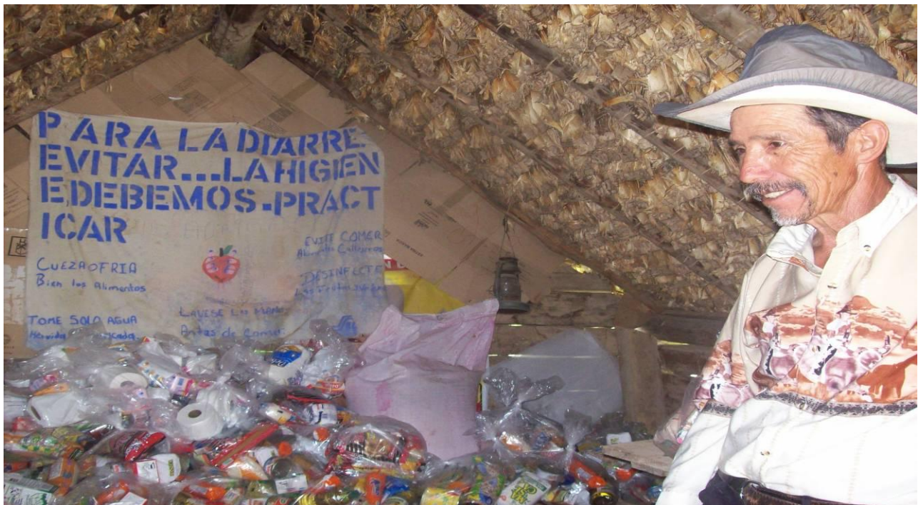
Imagen 9: En casa de Don José, en Tepozanes -de palma y cartón-, donde se dejaron las despensas de Puerto del Aire y El Rosillo, a quienes se les mandó avisar mediante vecinos del lugar que fueron en animales y a pie para dejar razón.