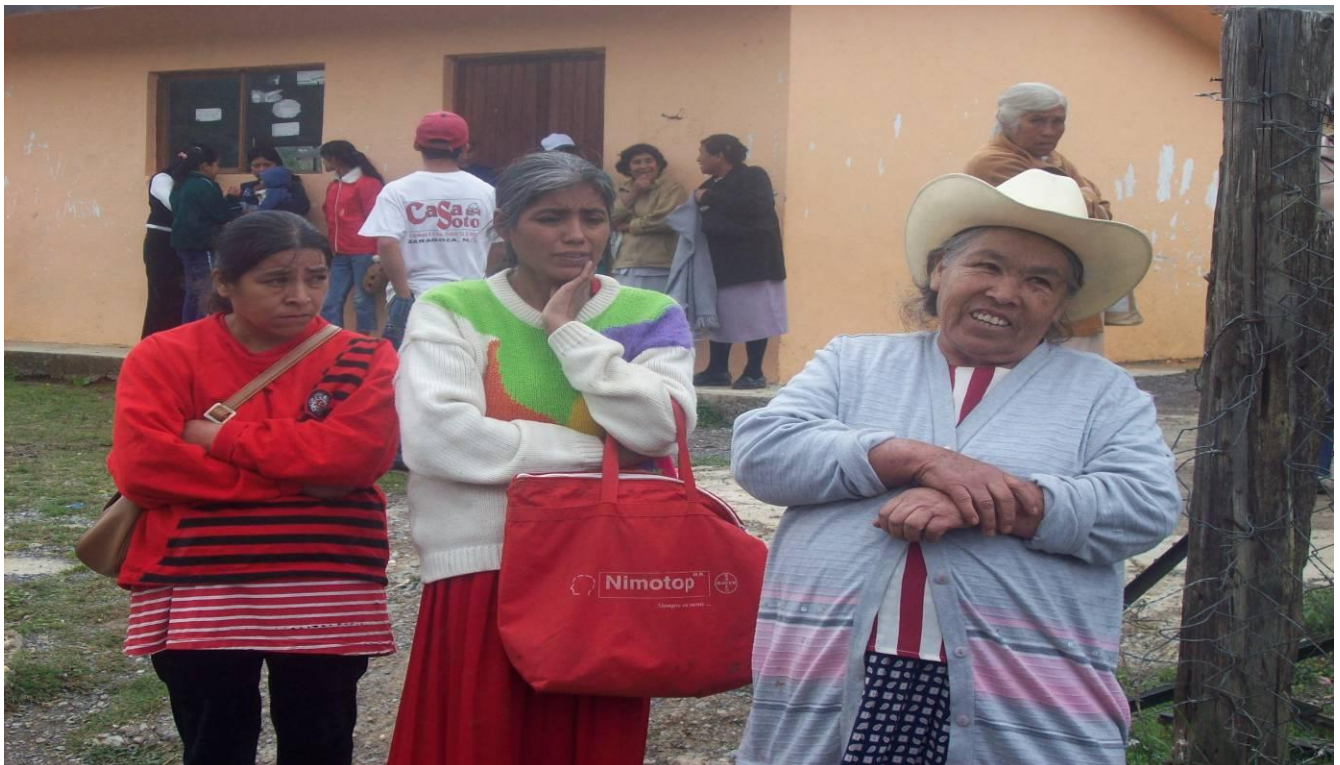
Imagen 7: señoras de El Muerto