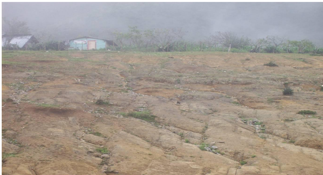
Imagen 3: Llegando a Tepozanes: casas de madera a lo lejos y suelo erosionado al frente