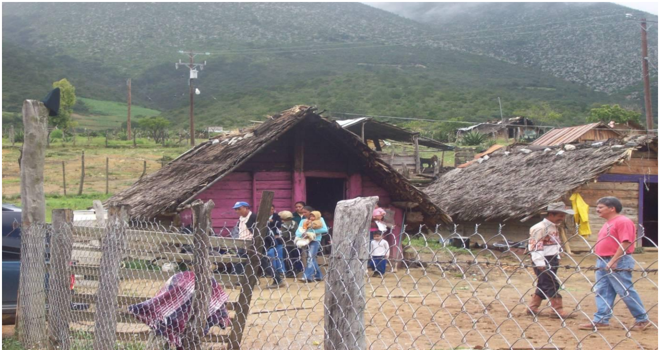
Imagen 6: En Tepozanes dejando las despensas y ropa