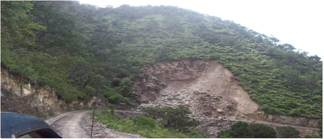
Imagen 12. De regreso los deslaves. Paredes de cerro que se cayeron y continúan resquebrajándose afectando los caminos.