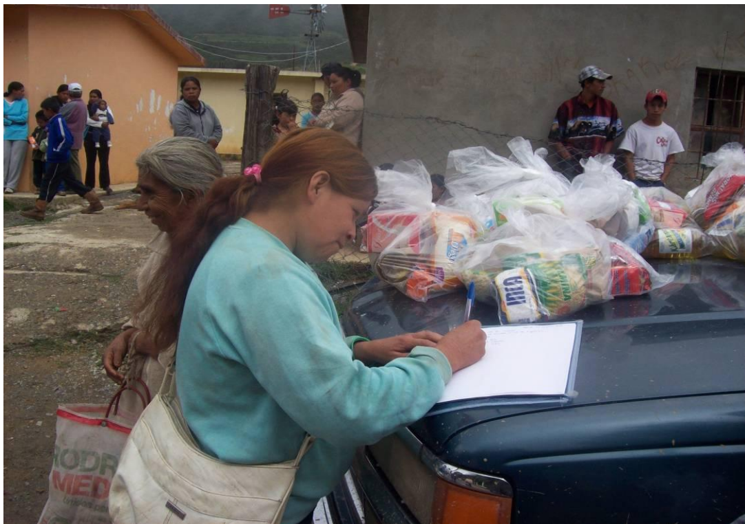
Imagen 5- Registro a la entrega de víveres